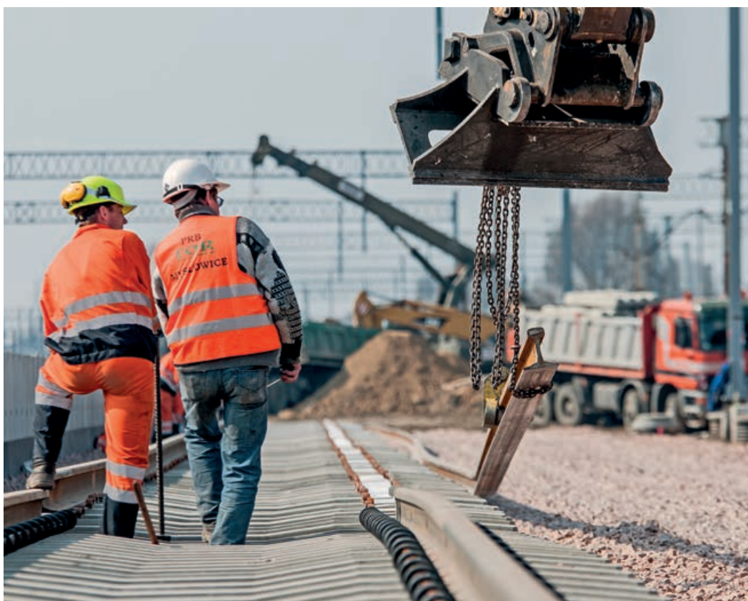
Investycje planowane przez wykonawców kolejowych w ciągu najbliższych 2 lat

Firmy, które planują inwestycje w sprzęt i maszyny budowlane, najczęściej jako obszar planowanego wzmocnienia swojego parku maszynowego wymieniają lekki sprzęt do prac torowych (praktycznie wszystkie duże firmy wykonawcze planują doposażenia