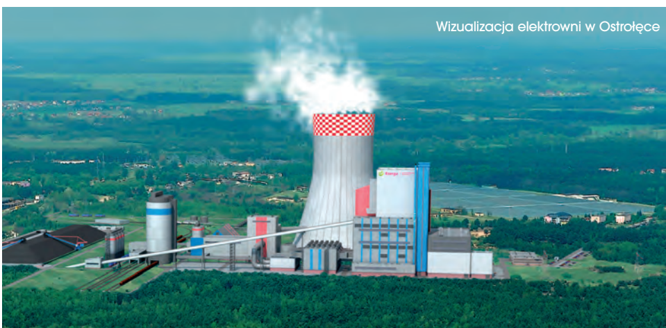
Wizualizacja elektrowni w Ostrołęce