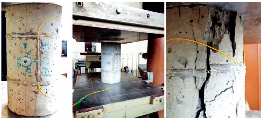
Rys. 2. Widok badanej próbki