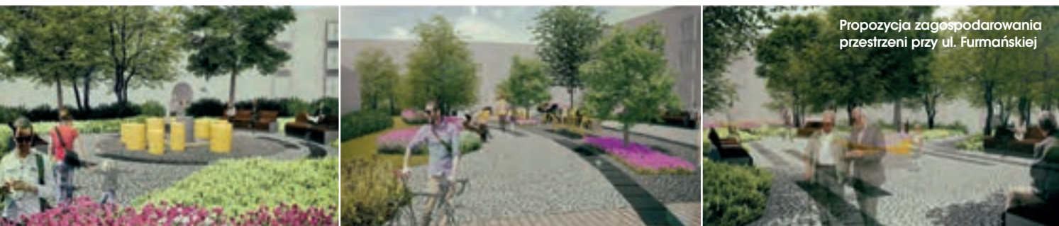
Propozycja zagospodarowania przestrzeni przy ul. Furmańskiej

Zachodnia część obszaru to kwartały zabudowy zabytkowej z XIX i XX wieku, pełniące tradycyjnie zróżnicowane funkcje, głównie mieszkaniowe i usługowe (w zaniku) o pogłębiających się