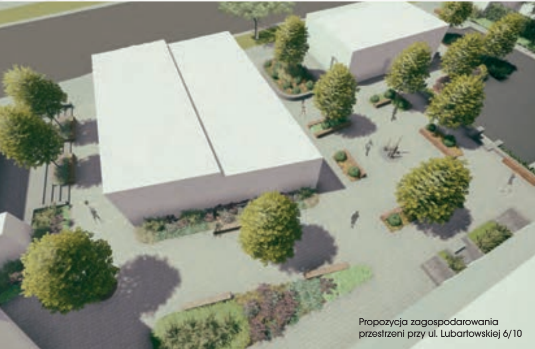
Propozycja zagospodarowania przestrzeni przy ul. Lubartowskiej 6/10

Modelowy projekt rewitalizacji obszaru ul. Lubartowskiej i dawnego Podzamcza w Lublinie zakłada ożywienie gospodarcze dzięki zintegrowanej poprawie zarządzania zasobem komunalnym, działań społecznych i stanu zabudowy zabytkowej.