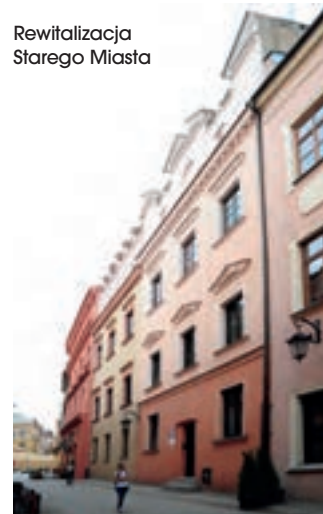
Rewitalizacja Starego Miasta

adaptowany na potrzeby Państwowej Szkoły Muzycznej I i II stopnia im. T. Szeligowskiego w Lublinie. Przedmiotem tego projektu była kompleksowa rewitalizacja obszaru położonego w centrum Lublina, w obrębie układu urbanistycznego wpisanego do rejestru zabytków. Inwestycja jest kontynuacją zrealizowanego w ramach Phare SSG 2000 projektu „Renowacja Starego Miasta”, który obejmował m.in. przebudowę ul. Narutowicza na odcinku od Pl. Wolności do ul. Okopowej wraz z przyległymi uliczkami. W ramach realizacji projektu wartego ponad 23 mln zł przebudowana została ul. Narutowicza na odcinku od skrzyżowania