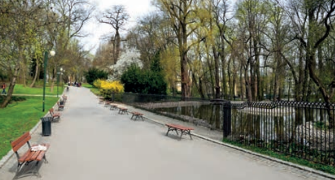
Rewaloryzacja Ogrodu Saskiego