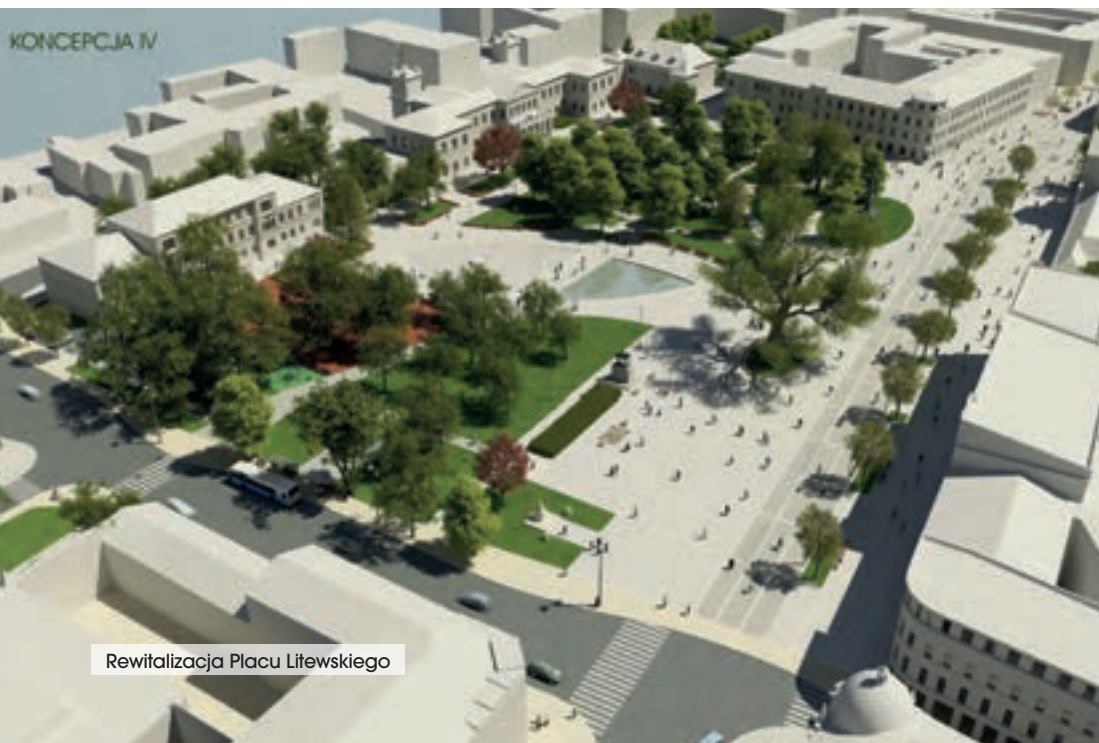
Rewitalizacja Placu Litewskiego

Lublin w obecnym okresie programowania kontynuuje zadania z zakresu rewitalizacji miasta. Przykładowym projektem planowanym do realizacji jest rewitalizacja części Śródmieścia Miasta warta ok. 61 mln zł.