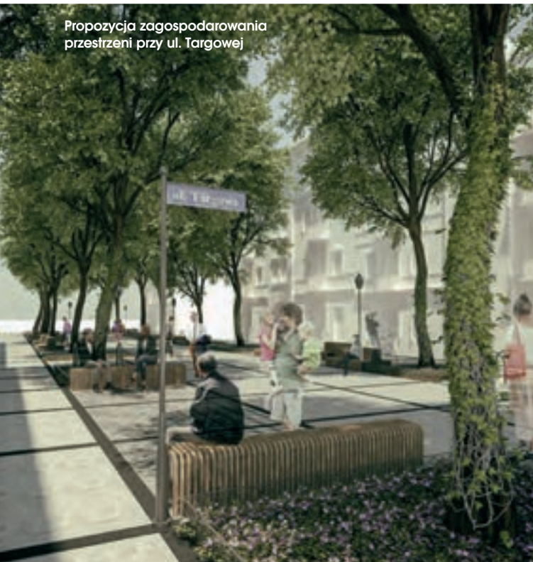
Propozycja zagospodarowania przestrzeni przy ul. Targowej

Modelowy projekt rewitalizacji obszaru ul. Lubartowskiej i dawnego Podzamcza w Lublinie zakłada ożywienie gospodarcze dzięki zintegrowanej poprawie zarządzania zasobem komunalnym, działań społecznych i stanu zabudowy zabytkowej.