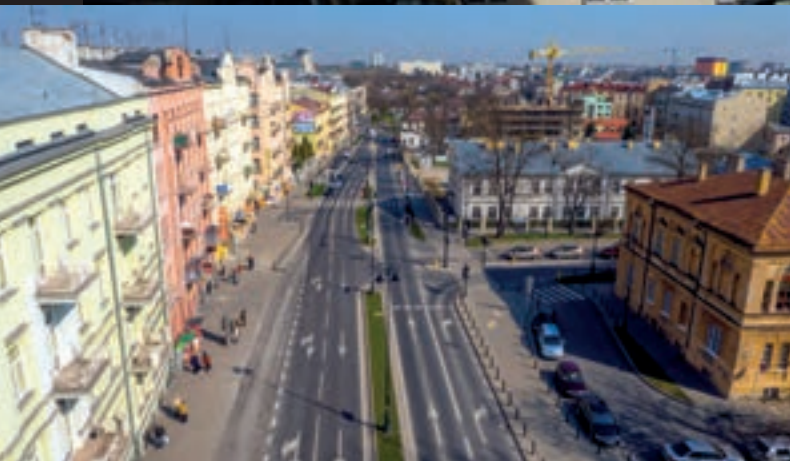
Przebudowa ulic: 3-go Maja i Radziwiłłowskiej wraz ze skrzyżowaniami i elementami okolicznej architektury

Lublin w poprzednim okresie programowania zrealizował cztery projekty inwestycyjne w zakresie rewitalizacji na łączną kwotę 50,3 mln zł przy wsparciu środków unijnych w wysokości ponad 23,1 mln zł.