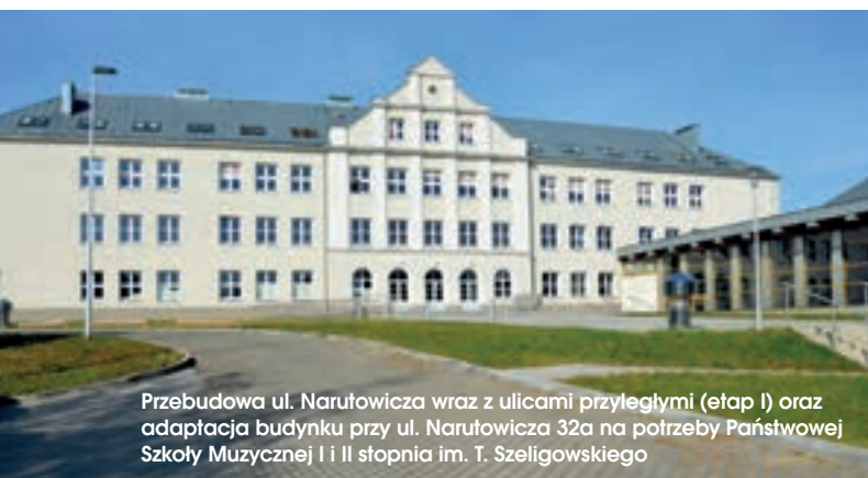
Przebudowa ul. Narutowicza wraz z ulicami przyległymi (etap I) oraz adaptacja budynku przy ul. Narutowicza 32a na potrzeby Państwowej Szkoły Muzycznej I i II stopnia im. T. Szeligowskiego

Lublin w poprzednim okresie programowania zrealizował cztery projekty inwestycyjne w zakresie rewitalizacji na łączną kwotę 50,3 mln zł przy wsparciu środków unijnych w wysokości ponad 23,1 mln zł.