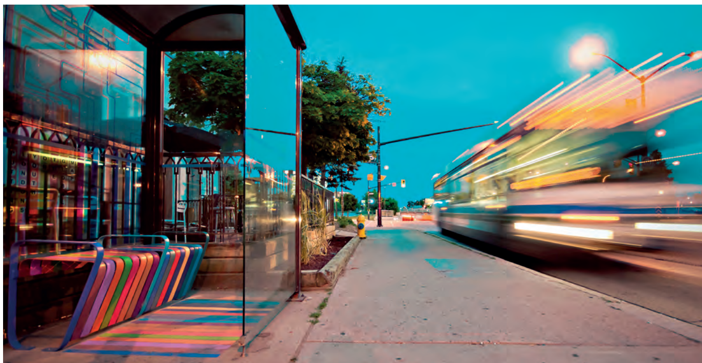
For. arch. perelccom

Współczynnik podaje, jaka część energii promieniowania słonecznego padającego na szybę przenika do pomieszczenia. Wartość tego parametru można regulować poprzez zastosowanie szkła przeciwsłonecznych, co realizowane jest przez odpowiedni dobór szkła i powłok. Parametr ten ma wpływ na bilans energetyczny pomieszczeń w okresach zimowych, czyli tzw. zysków solarnych.