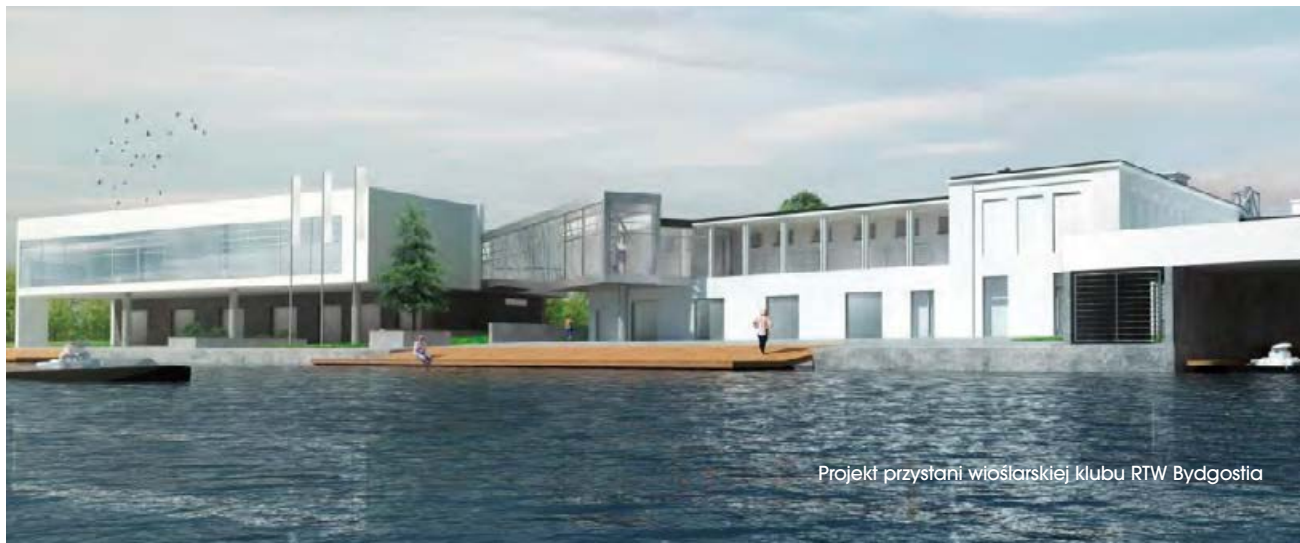
Projekt przystani wioślarskiej klubu RTW Bydgoszcz

W ramach zadania pod nazwą Rewitalizacja Starego Rynku i ulic przyległych zmieni się też wygląd stycznego do Brdy Rybiego Rynku. Ma on zyskać charakter placu publicznego. Od tego roku zaczyna się urządzenie na tym placu okolicznościowych jarmarków.