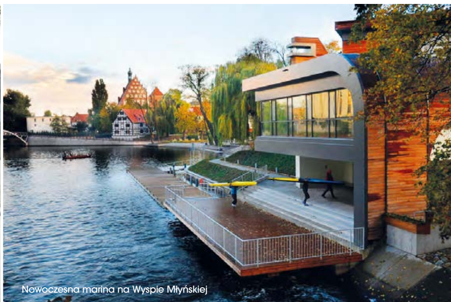
Nowoczesna marina na Wyspie Młyńskiej