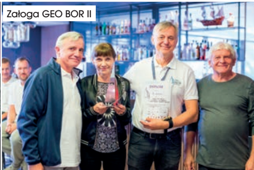
Załoga GEO BOR II