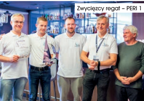
Zwycięzcy regat – PERI 1