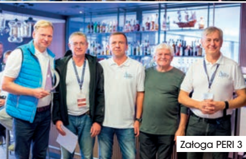
Załoga PERI 3