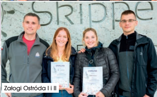
Załogi Ostróda I i II