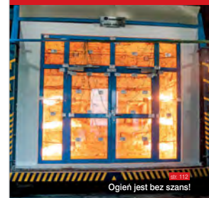
Ogień jest bez szans!