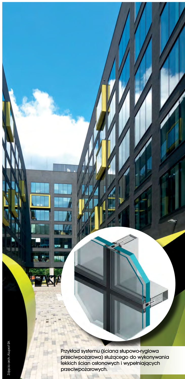
Przykład systemu (ściana słupowo-ryglowa przeciwpożarowa) służącego do wykonywania lekkich ścian osłonowych i wypełniających przeciwpożarowych.

Ściany zewnętrzne mogą spełniać dwojakie funkcje [2]: 1. ograniczać rozprzestrzenianie się ognia pomiędzy budynkami i kondygnacjami budynku, 2. ograniczać rozprzestrzenianie się ognia i dymu tylko pomiędzy kondygnacjami budynku.