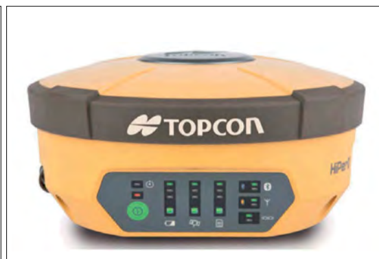
Rys. 3. Odbiornik GNSS (M4)