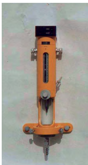
Rys. 5. Niwelator hydrostatyczny (M3)