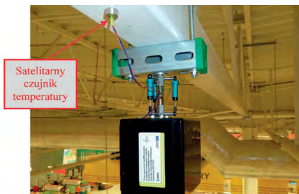
Satelitarny czujnik temperatury

Najprostsze zarówno w realizacji, jak i w interpretacji są pomiary przemieszczeń, które pozwalają uzyskać informacje o zachowaniu się elementu/ustroju konstrukcyjnego albo dużego fragmentu konstrukcji. Jednocześnie przemieszczenie jest wielkością bardzo charakterystyczną dla konstrukcji i dobrze odzwierciedla jej zachowanie się pod obciążeniem. Pomiary odkształceń pozwalają z kolei uzyskać lokalne informacje o zmianach w konkretnych miejscach – jak pokazuje praktyka, są one jednak trudniejsze w interpretacji, a co za tym idzie, prawidłowa ocena tych wyników następuje pewnych trudności. Pomiar temperatury jest często trak-