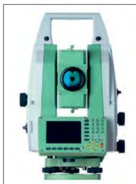
Rys. 2. Tachimetr automatyczny Leica (M1)