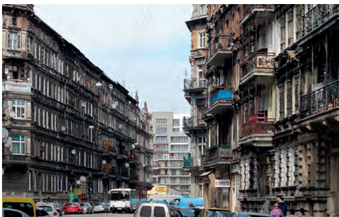
Fot. 3. Na Przedmieściu Oławskim stare spotyka się z nowym, co zostało docenione również przez inwestorów i nowych mieszkańców. Wizerunek osiedla się zmienia