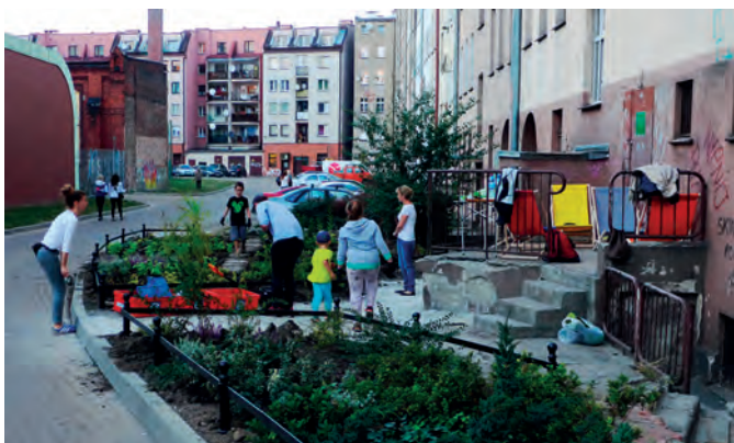
Fot. 4. Mieszkańcom bardzo zależy na remontach w ich najbliższym otoczeniu. Przy niewielkim wsparciu coraz chętniej sami włączają się w inicjatywy na rzecz sąsiedztwa

z ogromną aprobatą mieszkańców. Nabrzeża kąpieliska zostały częściowo wyremontowane dzięki szerokiemu poparciu inicjatywy oddolnej – projekt zrealizowany został częściowo w ramach Wrocławskiego Budżetu Obywatelskiego 2015 (w progu budżetowym do 150 tys. zł). Kolejny fragment jest przewidziany do realizacji jako zwycięzca WBO 2016 (w progu budżetowym do 250 tys. zł), a odcinek nabrzeży ujęty w Masterplanie został wpisany do Lokalnego Programu Rewitalizacji Wrocławia na lata 2016–2018 , spotykając się z samymi pozytywnymi głosami w czasie konsultacji społecznych (przewidywana alokacja środków wynosi około 7 mln zł). Oba projekty zakładają stworzenie warunków dla zachowania ciągłości przejść i przejazdów rowerowych, udostępnienie i podniesienie bezpieczeństwa przestrzeni publicznej, dostosowanie jej dla zróżnicowanych grup użytkowników. Tym samym życie wraca nad Oławę, a mieszkańcy Przedmieścia Oławskiego wyczekują etapu realizacji.