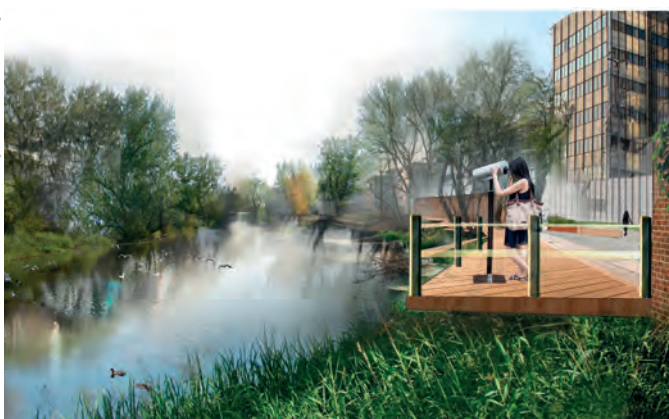
Fot. 1, 2. Rzeka Oława jest przyrodniczą i rekreacyjną perłą osiedla. Dzięki zagospodarowaniu przestrzeni publicznych mieszkańcy znów będą mogli cieszyć się nabrzeżami