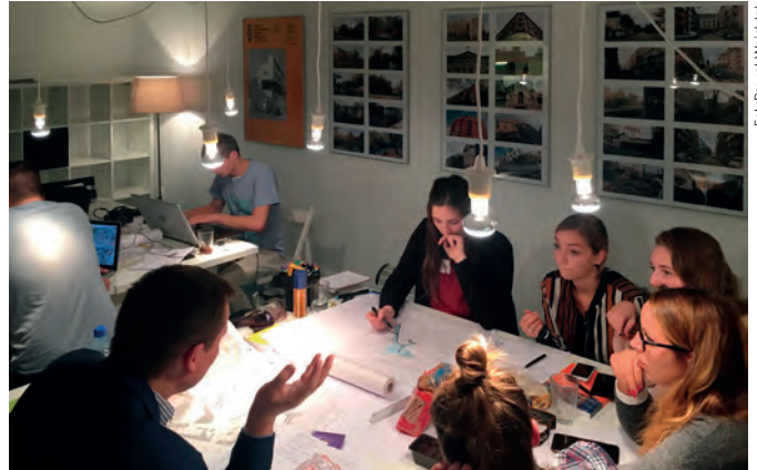
Fot. 6, 7. Lokalne Biuro Rewitalizacji to miejsce spotkań, współpracy, doradztwa, dyskusji i wymiany doświadczeń. To również siedziba managera kwartálu