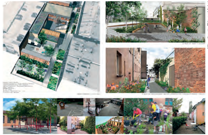
Fot. 5. Mieszkańcy niecierpliwie czekają na realizację centrów aktywności lokalnej

Wrocław może poszczycić się już pozytywnymi efektami rewitalizacji – bowiem obszar rewitalizacji Nadodrze dzięki swojej przemianie zainicjowanej na etapie poprzedniego okresu programowania UE stał się dla wrocławian symbolem rewitalizacji. Kilkanaście lat intensywnych i wszechstronnych starań na rzecz tego osiedla zaowocowało widoczną poprawą na wszystkich płaszczyznach, szczególnie w dziedzinach bezpośrednio dotyczących jakości życia i pracy. Doświadczenia te są inspirujące, rozbudzają nadzieje i oczekiwania wobec zmian, które wydają się tym bardziej możliwe na Przedmieściu Oławskim. ■