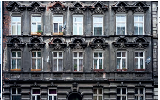
Fot. 8, 9. XIX-wieczne kamienice tworzą wyjątkowy klimat Przedmieścia Oławskiego i są miejscem życia dla większości 24-tysięcznej społeczności osiedla