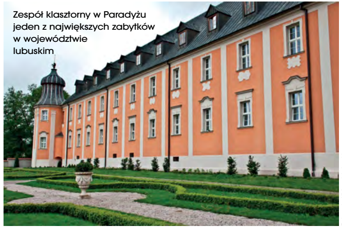
Zespół klasztorny w Paradyżu jeden z największych zabytków w województwie lubuskim