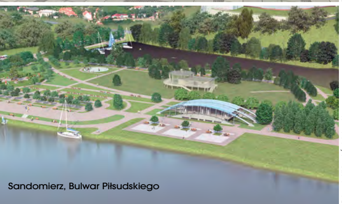
Sandomierz, Bulwar Piłsudskiego