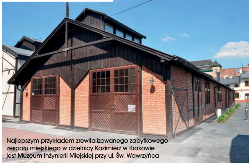
Najlepszym przykładem zrewitalizowanego zabytkowego zespołu miejskiego w dzielnicy Kazimierz w Krakowie jest Muzeum Inżynierii Miejskiej przy ul. Św. Wawrzyńca

dynków mieszkalnych, tj. odnowienie elementów strukturalnych budynku (dachy, fasady, okna i drzwi w fasadzie, klatki schodowe i korytarze, windy).