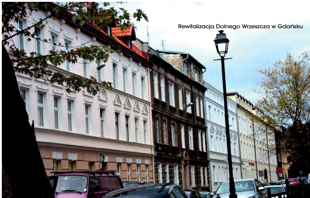
Rewitalizacja Dolnego Wrzeszcza w Gdańsku