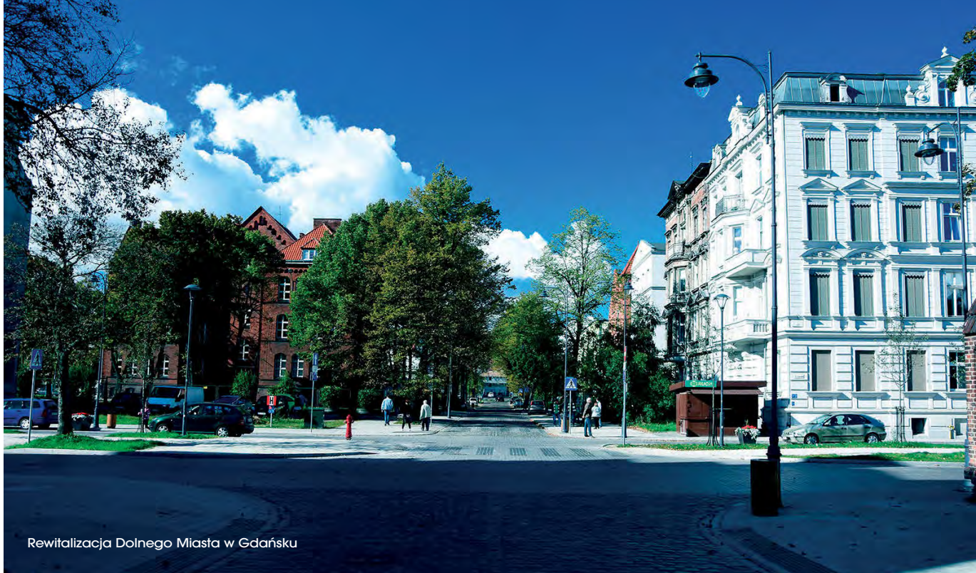
Rewitalizacja Dolnego Miasta w Gdańsku