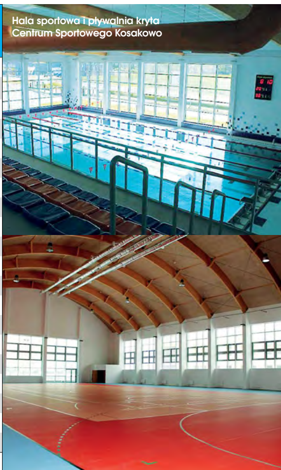
Hala sportowa i pływalnia kryta Centrum Sportowego Kosakowo