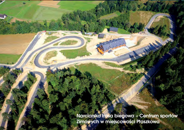
Narciarska trasa biegowa – Centrum sportów Zimowych w miejscowości Piaszkowa