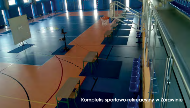
Kompleks sportowo-rekreacyjny w Żorawinie