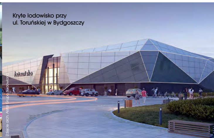
Kryte lodowisko przy ul. Toruńskiej w Bydgoszczy