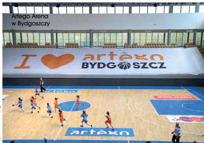
Artego Arena w Bydgoszczy

będzie mogło być wykorzystywane całorocznie. Bryła będzie przypominać lodowy kryształ. Na elewacji dominować będą okładziny w srebrnym kolorze oraz szkło. Nowoczesny budynek będzie wyposażony w wiele ciekawych rozwiązań. Jednym z nich jest połączenie betonu z drewnem w postaci dźwigarów dachowych, które zostaną wzniesione nad halą lodowiska o rozpiętości 40 m. Urząd Miasta Bydgoszczy ma w planach dwie inwestycje: budowę hali treningowej wraz z siłownią na terenie kompleksu sportowego Zawisza przy ul. Gdańskiej oraz przebu-