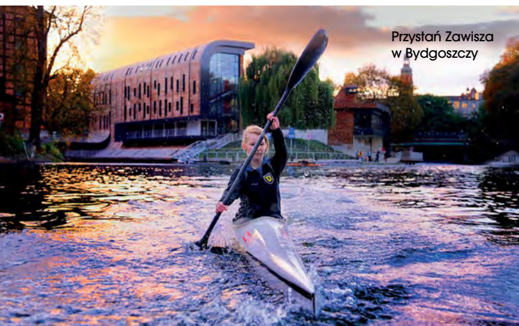
Przystań Zawisza w Bydgoszczy

nami dla 300 osób oraz obiekt z sanitariatem i szatniami. Przesuwa się w czasie ogłoszenie przetargu na wybór wykonawcy przebudowy stadionu Wisły Płock. Inwestor nie domknął jeszcze finansowania projektu, który zakłada wyburzenie obu trybun i budynku klubowego. Zamiast nich mają powstać dwie nowe trybuny sięgające bezpośrednio płyty boiska oraz trzecia – północna. Zostaną one zadaszone, a stadion wyposażony w nowy system sztucznego oraz awaryjnego oświetlenia. Inwestycja pochłonie ok. 98 mln zł. Podobnie odwleka się rozpoczęcie procedury wyboru wykonawcy przebudowy