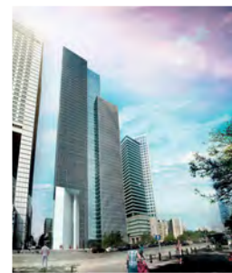
Fot. arch. Kurylowicz & Associates