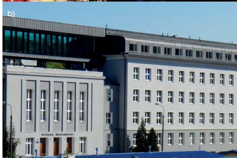
Rys. 2. Nadbudowa istniejących budynków a) obiektu użyteczności publicznej – Warszawa, b) budynek Wydziału Mechanicznego Politechniki Gdańskiej