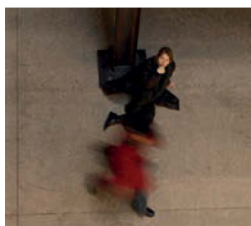
Fot. arch. OVO Grąbczewscy Architekci

6 PROFILE Romuald Loegler Atelier Loegler Architektki